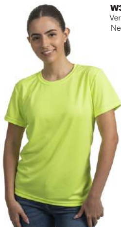
W31 Verde Neón